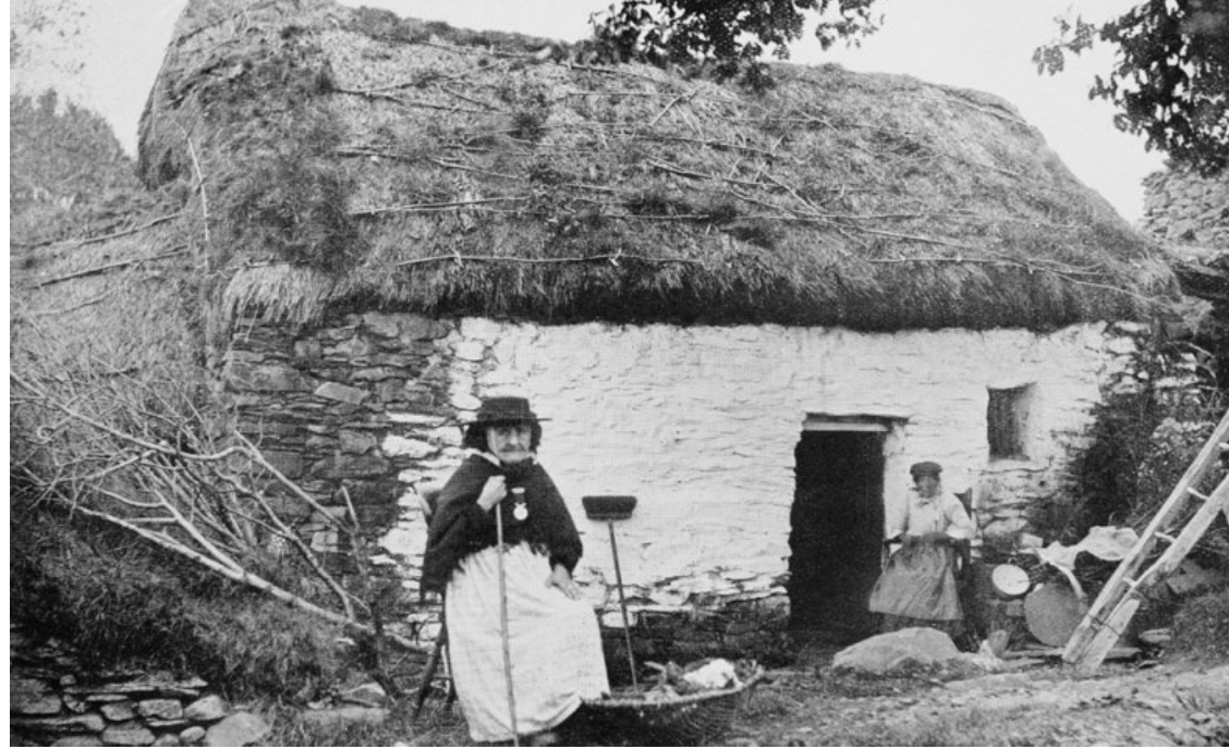
Uchod: Bwthyn Cymreig traddodiadol: Castell Cottage, Ystrad Fflur O Casgliadau Cofnod Henebion Cenedlaethol Cymru

a hynod sydd wedi helpu i greu cymeriad nodweddiadol ein trefi, ein pentrefi a'n tirweddau cefn gwlad, a hunaniaeth y cymunedau sy'n byw ynddynt.