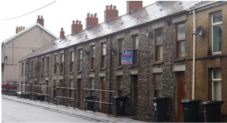
Llun y clawr: Bwthyn Nantwallter